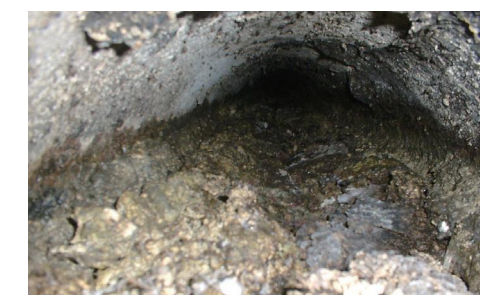
油で下水管が半分詰まった状態