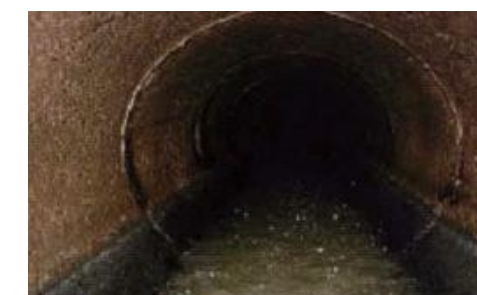
良好に流れている下水管の様子

天ぷら油などをそのまま流すと、排水管や下水管が詰まる原因となり、排水が流れなくなったり、宅地内で排水が溢れることがあります。また、水処理センターでの下水処理に負担がかかります。天ぷら油は固化してから処分するなど、下水道に油を流さないようにご協力をお願いします。調理後のフライパンや皿についた油污は、調理で使用したキッチンペーパーなどでふき取ってから洗いましょう。