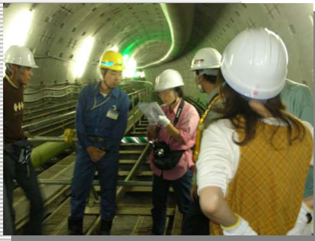
平成17年度の道路工事モニター 「道路工事見学会」の様子

道路工事モニターは、市民の皆さんから、道路工事 へのご意見をいただいたり、道路工事の見学や道路工 事の基本的な知識を得ることによって、道路工事への 理解を深めていただく制度です。