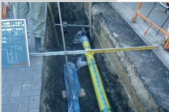
水道管とガス管の共同施工のようす