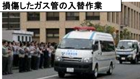
被災地に向け出発する車両を見送る社員