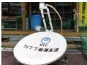
ポータブル衛星電話

東日本大震災では、東北及び関東地方の情報通信ネットワーク設備とそれをご利用いただく多くのお客様の生活が破壊されました。