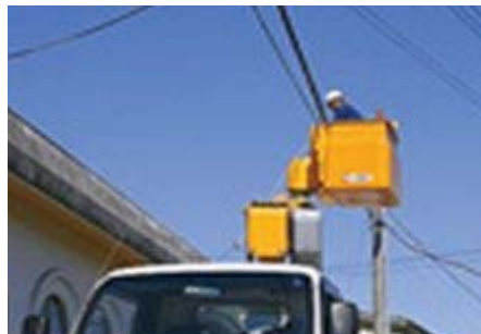
震災後の通信ケーブルの応急復旧作業