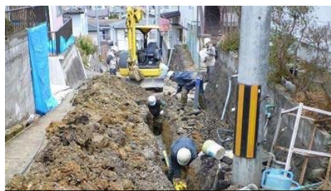
損傷したガス管の入替作業

東邦ガスでは、大規模な地震に備え、耐震性の高い、安全なガス設備の整備や、従業員等関係者に対する教育を進めています。