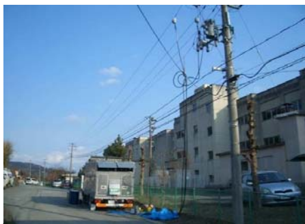
避難所への仮送電

被災地へは片道約 800km にわたる行程を復旧車両（52 台）で移動し、主な任務は避難所や病院などへ高圧発電機車による仮送電をはじめ、傾いた電柱の建て起こしや各家庭への切れた引込線の修理を行うなど、早期に電気をお届けするため、約 1 か月にわたり復旧作業に従事してまいりました。今後も弊社電力供給エリアにおいて東海地震など想定される大規模災害における早期復旧へ向けた防災訓練や復旧訓練を行い、高品質な電気の安定供給に努めてまいります。