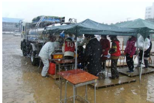
雪の降る中での応急給水活動

下水道部門は、岩手県久慈市及び宮城県石巻市内の下水道管路の被害状況調査を行っており、5月10日まで総勢16隊82名の職員を派遣しました。他の支援都市とも協力しあいながら、路面状況の調査と地上からマンホールの蓋を開けて内部を目視する調査を約335km実施し、テレビカメラを管路内に入れて撮影する、より詳細な調査を約28km実施しました。