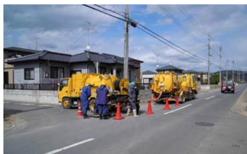
テレビカメラ調査状況