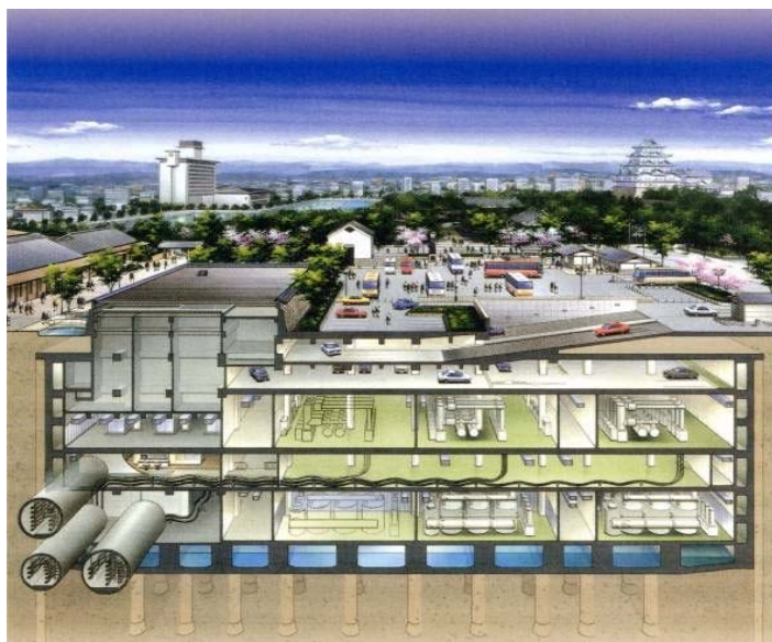
▲中部電力(株)名城変電所

中部電力株式会社の名城変電所は、名古屋城正門前の駐車場の地下空間に設置された新しい形の変電所です。