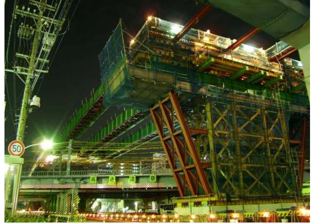
▲桁送り出しの様子

今回架設した場所は、真下に鉄道が走行しているため、工事を東海旅客鉄道（株）に委託して、夜間の列車本数の少ない時間帯を利用しながら工事を行い、