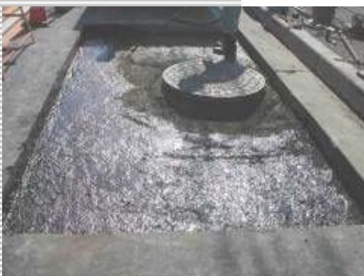
▲従来工法【角切り工法】

また、六角形のサイズを自由に設定できるので、金蓋の大きさに柔軟に対応でき、あらかじめ六角形の頂点部分に穴をあけて“カド”をなくすことで“カド”を起点とした舗装の亀裂を生じにくくしています。